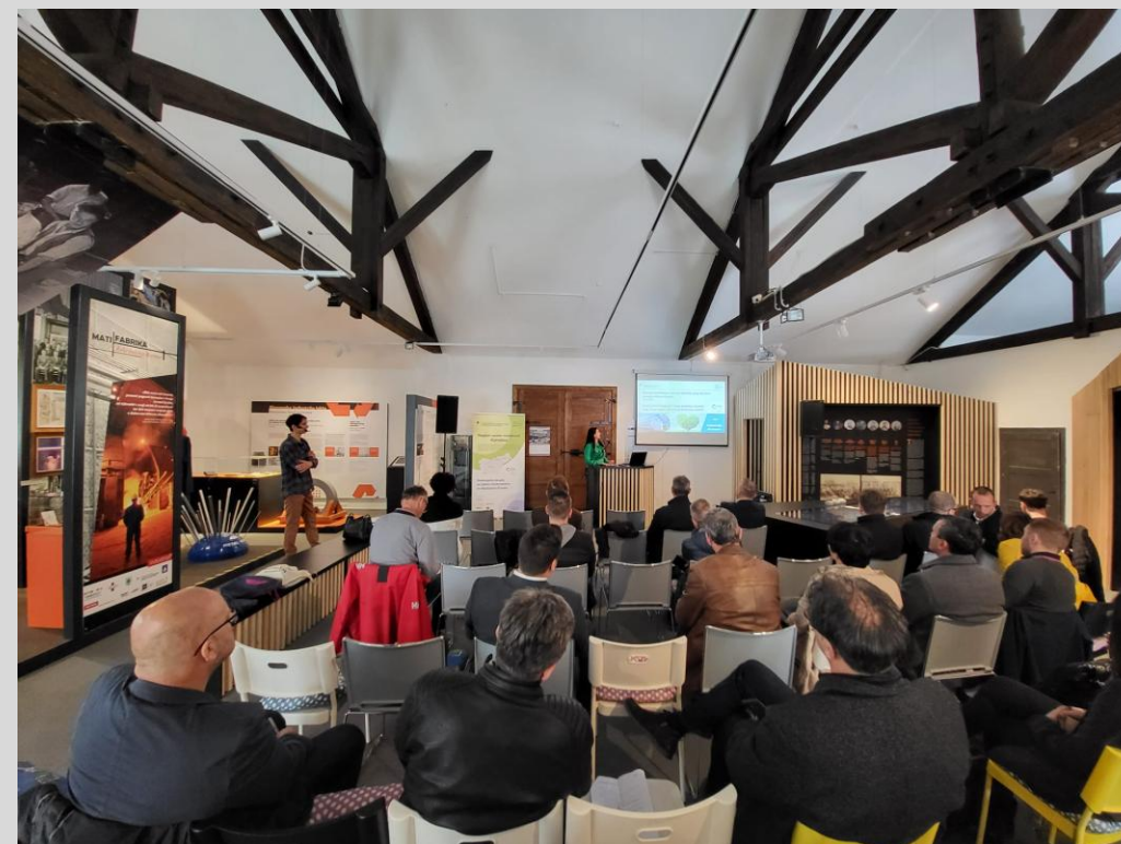
Razvojna konferenca o Koroški železniški progi, 19. 4. 2023, Ravne na Koroškem